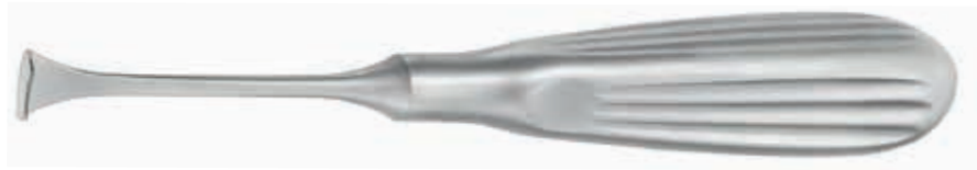
67.60.16 Tastan-Cakir Säge konkav / Tastan-Cakir Saw concave