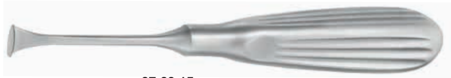
67.60.15 Tastan-Cakir Säge konvex / Tastan-Cakir Saw convex