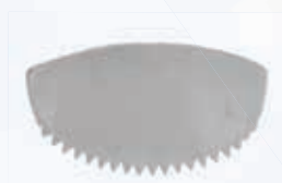
konvex / convex